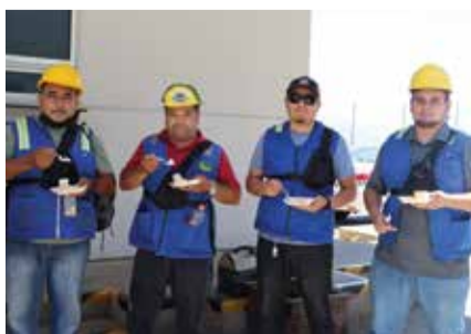
Algunos de los colaboradores del área operativa de Hutchison Ports EIT