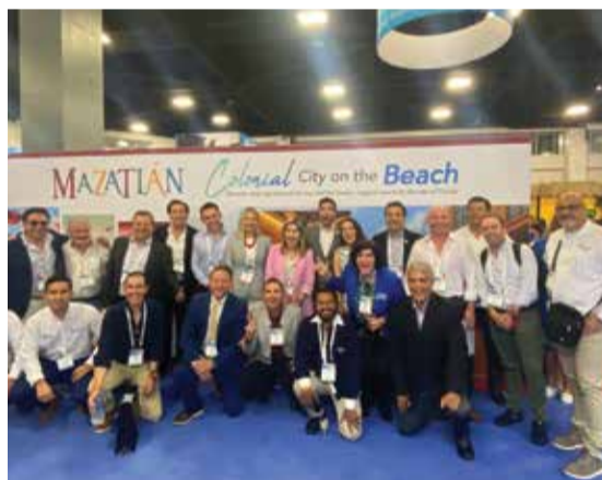
Asistentes de los puertos de terminales de cruceros en México en el Centro de Conferencias Seatrade Global 2022.