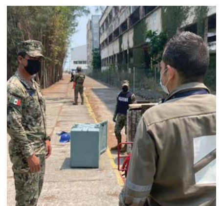
Personal de protección portuaria de TNG, coordinando actividades de campo con personal de la FIDENA

Se agradece a todo el personal de las diversas áreas que fueron entrevistados o que participaron con alguna actividad previa durante el desarrollo de la auditoría.