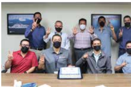
Los colaboradores de las oficinas administrativas de EIT que son padres, haciendo seña con sus manos de cuántos hijos tiene cada uno.

Este 20 de Junio, se festejó el día del Padre por cada área de trabajo, con una rica rebanada de pastel y un rato de convivencia en horas laborables. El evento se dividió en tres horarios; el primero fue a las 10:00 a.m. en las oficinas administrativas, para los papás que laboran ahí. El segundo tuvo lugar en la Marina a las 11:00 horas y el tercero en la entrada de las oficinas operativas a las 13:00 horas. Los compañeros se mostraron felices al disfrutar la pequeña convivencia que con gusto la empresa les organizó.