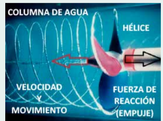
ENVIADO POR: CARLOS SANTIBAÑES REYNA, TNG.

La llamada fuerza de reacción (porque reacciona a la fuerza de la columna de agua) es desarrollada contra el elemento de velocidad-impartida. Esta fuerza, también llamada empuje, se transmite a la estructura del barco por el eje principal con sus respectivos elementos que integran el sistema de propulsión y hace que la embarcación se mueva a través del agua.