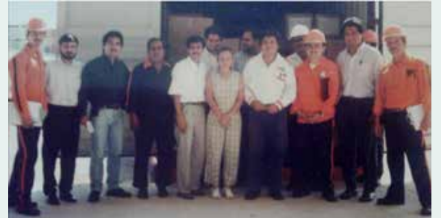
Zenón Ramos recuperó una fotografía de Roberany, antiguo fotógrafo oficial de la Empresa. El momento memorable fue del primer servicio de vaciado a Almacén CFS en la TECI.