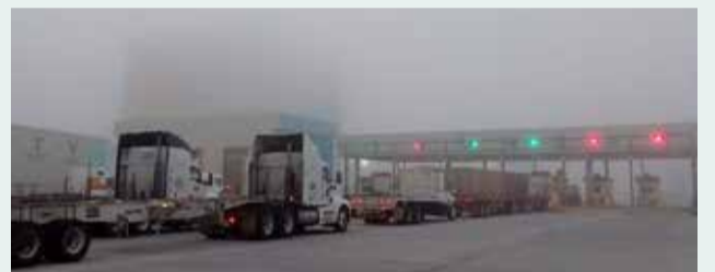
ENVIADO POR: ALAIN RENÉ ROLDÁN VALERIO, PUERTAS ENTRADA ICAVE